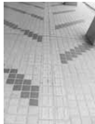
点字ブロックは障がい者の方が利用しますので荷物等が無いようにして下さい。