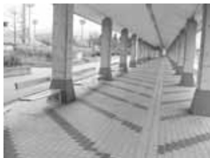
歩廊の椅子は移動したら元の位置に戻して下さい。