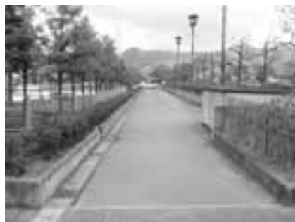
テニスコートと屋外プール間の通路です。練習や試合前アップでは使用しないで下さい。