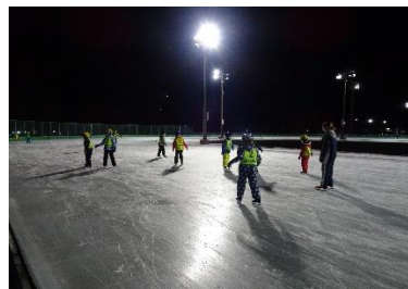
(チャレンジ!!!ジュニアスポーツスクールの様子)