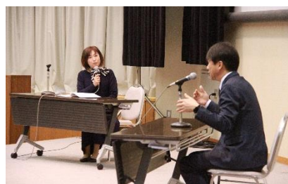
(山内智香子アナウンサーとのトークショーの様子)