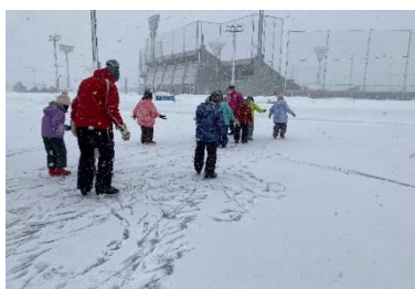
(学校体育等協力事業の様子)