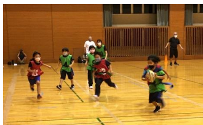
(多種目トライの様子)