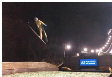
(スキージャンプ練習の様子)