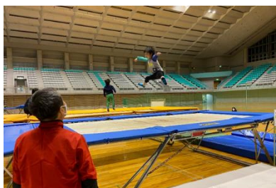
(チャレンジ!!!キッズスポーツスクールの様子)

発育発達期（幼児から小学6年生）を対象に、様々な運動やスポーツ等が体験できるスポーツ教室を4教室延べ19回開催し、募集定員130名に対し延べ627名の参加者を得て実施した。