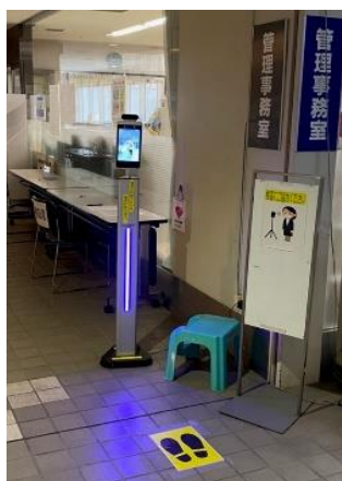
(受付入口へ検温器の設置)