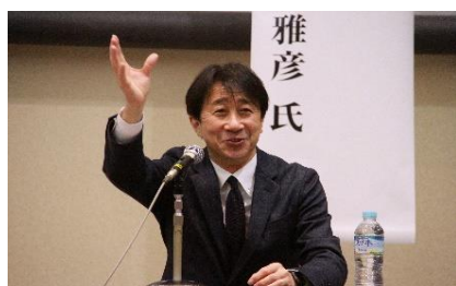
(スポーツ懇談会の様子)