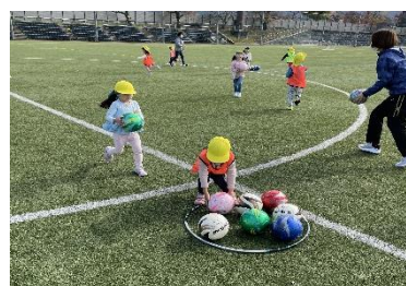
(保育園児への指導の様子)