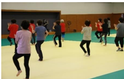
(スローエアロビック教室の様子)