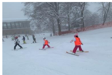
(山形市民スキー教室の様子)