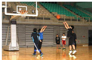
(バスケットボールの様子)