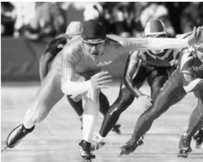
第60回国民体育大会(冬季大会)成年男子500mで初優勝を飾った

達は学年を超えた絆をつくり、先輩方が築いてきた「心から楽しんで踊り、見ている人を楽しさを伝える」ことの難しさと伝わった時の感動を肌で感じました。こんなに素晴らしい経験ができたことは、これからの私達の力となっていくと思います。これからも北高チアリーダー部は感謝の気持ちを忘れず、自分たちも楽しみ、見ている人も楽しませられる演技ができるよう努力していきます。そしてチアリーダーとしての原点を伝え続けていきます。