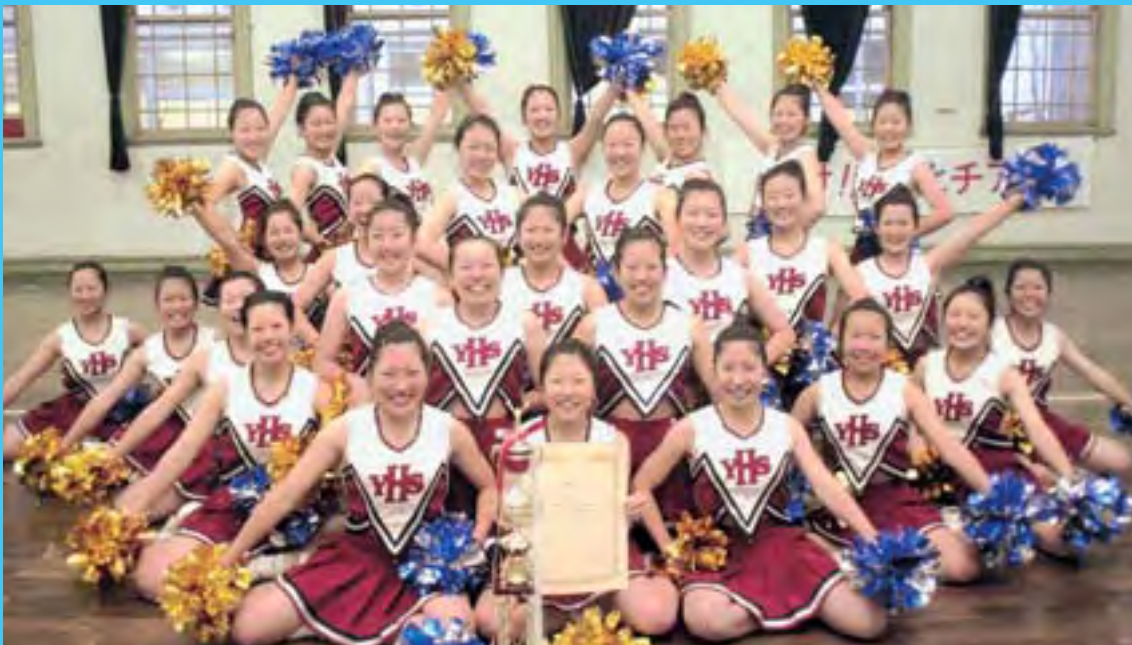
山形北高校チアリーダー部