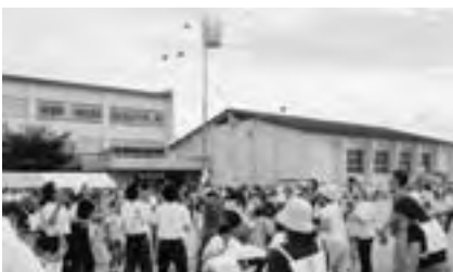
出羽地区 山形市合併50周年記念事業 出羽地区大運動会 平成16年8月29日(日)

これからも、スポーツを通して、出羽地区の人々との触合いを大切に、また、数多くのスポーツが地域に定着するように只今努力中であります。